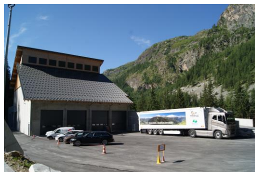
Le nouveau quai