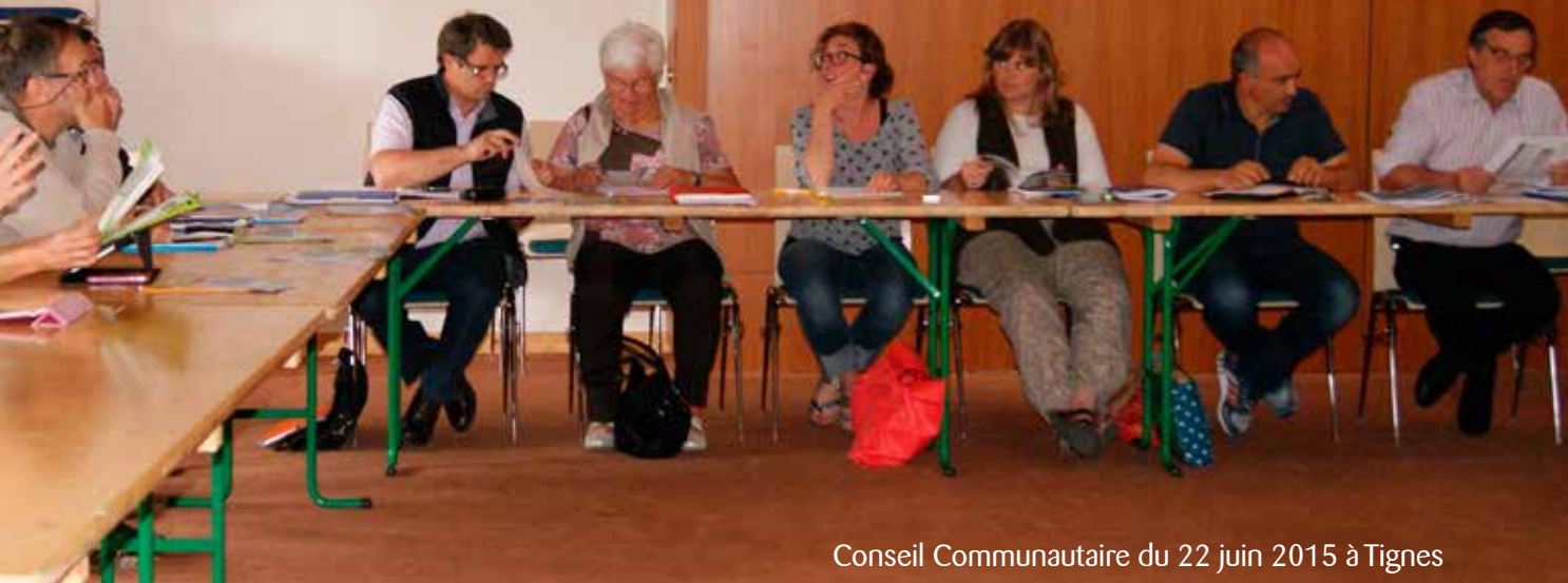
Conseil Communautaire du 22 juin 2015 à Tignes