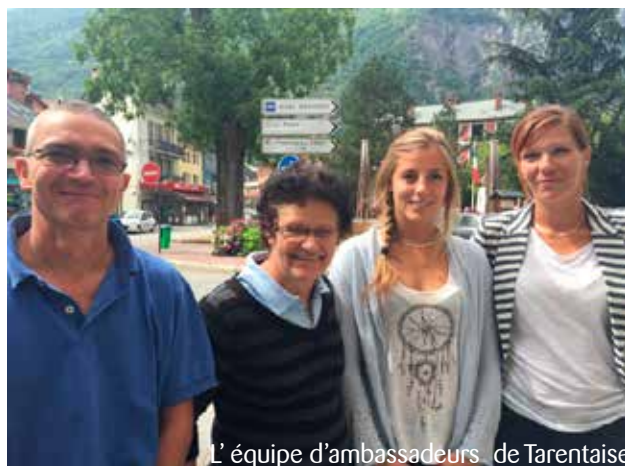
L'équipe d'ambassadeurs de Tarentaise

Cette action est organisée en partenariat avec la Communauté de Communes de Haute Tarentaise qui collecte les déchets et qui adhère au SMITOM de Tarentaise. L'opération de porte à porte est également réalisée à La Léchère et aux Allues. Chaque année, différentes communes en bénéficient et c'était notamment le cas en 2013, à Bourg Saint Maurice pour la Haute Tarentaise.