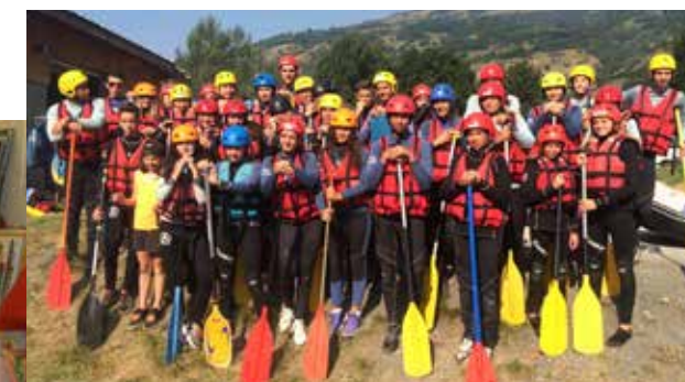
Activité proposée par l'Espace Jeunes