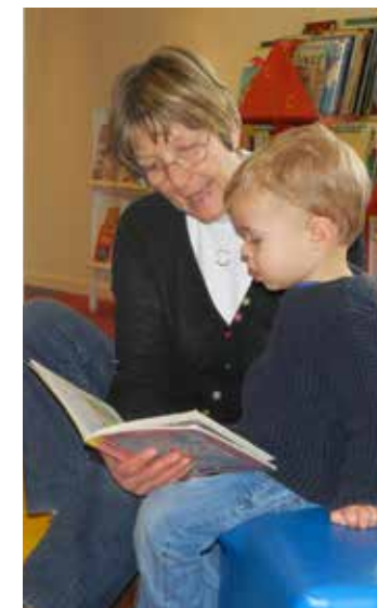
Activité proposée par le RAM

Service Enfance-Jeunesse - Communauté de Communes Immeuble le Verseau - Quartier des Epines à Bourg St Maurice 04.79.07.27.16 ou service-jeunesse@hautetarentaise.fr