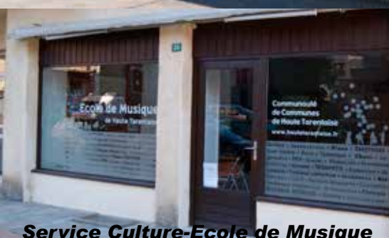
Service Culture-Ecole de Musique