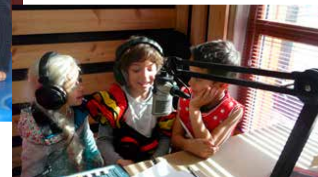
Activité proposée par les accueils de loisirs