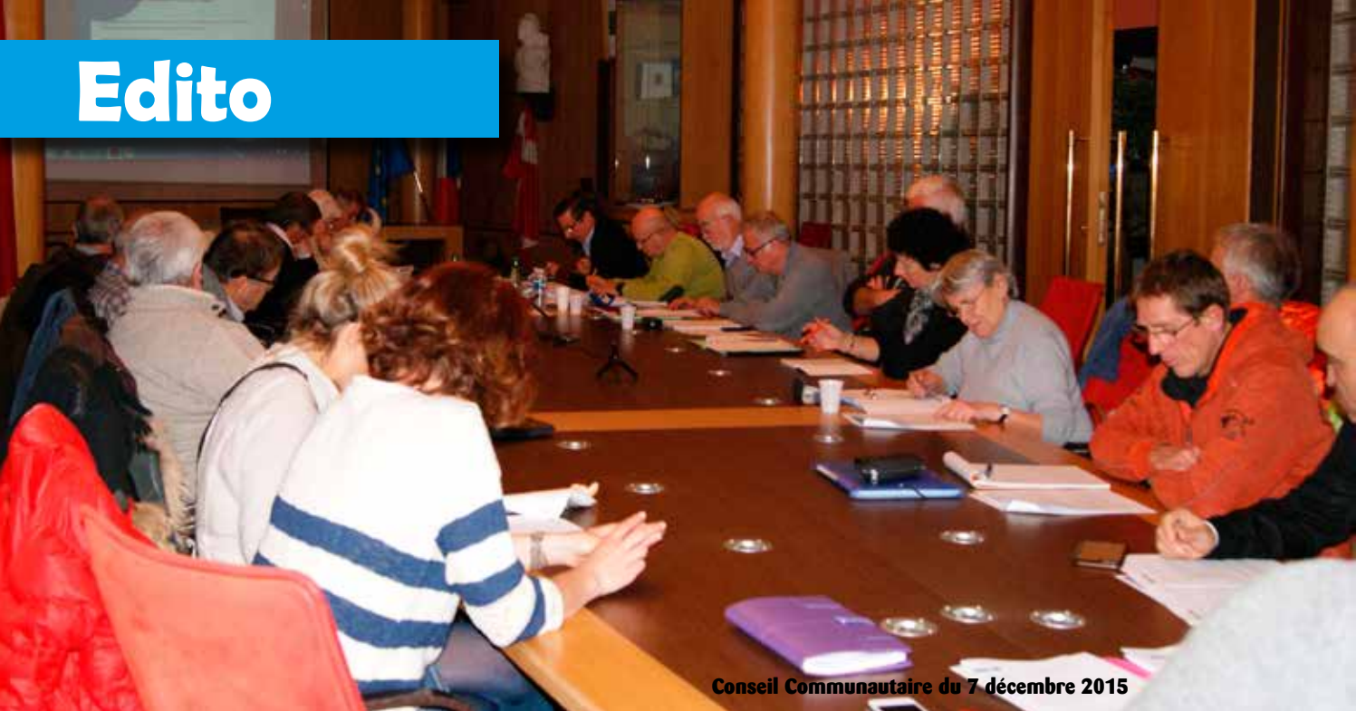
Conseil Communautaire du 7 décembre 2015