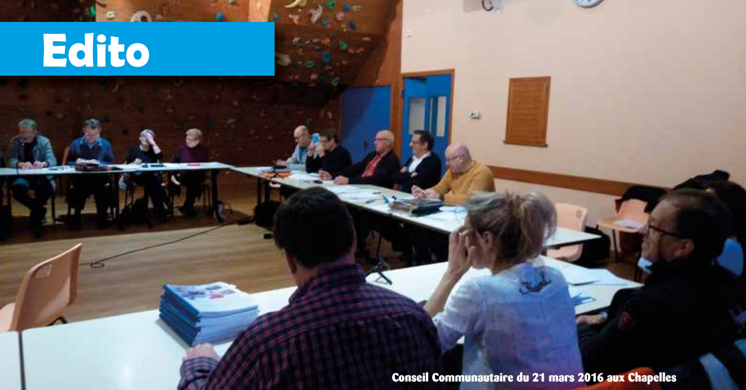
Conseil Communautaire du 21 mars 2016 aux Chapelles